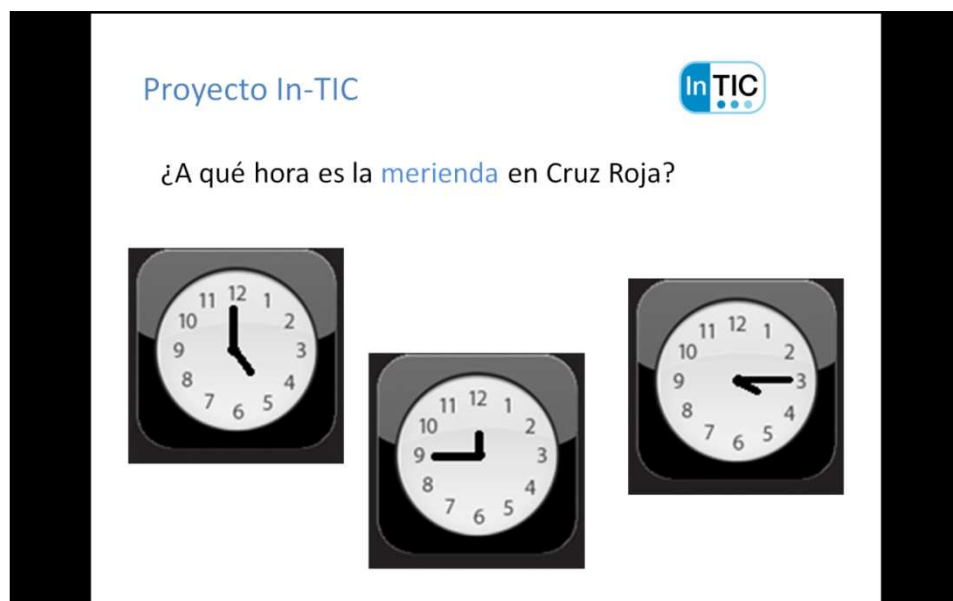
Figura 4. Finalmente, se muestra un ejercicio en el que la persona tiene que seleccionar la hora en la que tiene lugar la merienda en el Centro de Día de Cruz Roja.