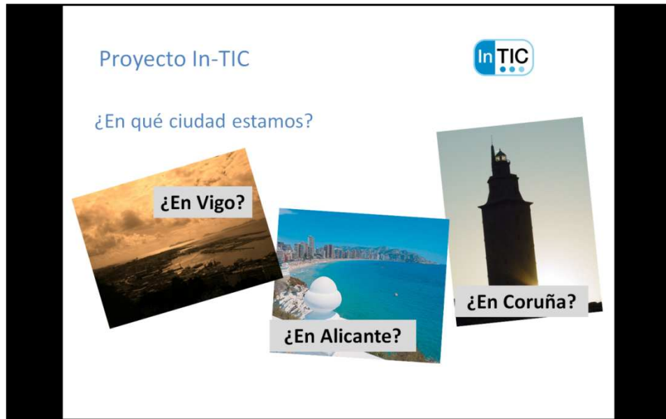
Figura 1. Ejercicio en el que la persona debe seleccionar la ciudad en la que reside.

Esta actividad se plantea como un ejemplo, pero el profesional podrá modificarla y adaptarla en función de las necesidades y capacidades de las personas con las que esté trabajando o elaborar otras actividades que considere más adecuadas a las características del grupo.